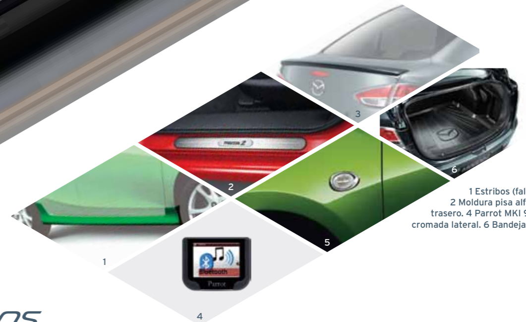
1 Estribos (faldón lateral inferior). 2 Moldura pisa alfombra. 3 "Spoiler" trasero. 4 Parrot MKI 9200. 5 Moldura cromada lateral. 6 Bandeja baúl.